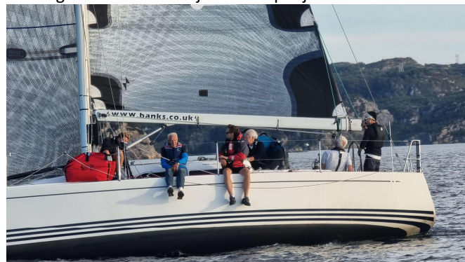
Ranegutt på Hjeltefjordtrimmen. Her skorter det ikke på seilerfaring!

I Hjeltefjord Trimmen er det alltid blodig alvor og RAN gjorde det sterkt og deltok med mange båter. Noen har hatt med flyktninger fra Ukraina som mannskap og av og til er det ganske så internasjonalt ute på fjorden.