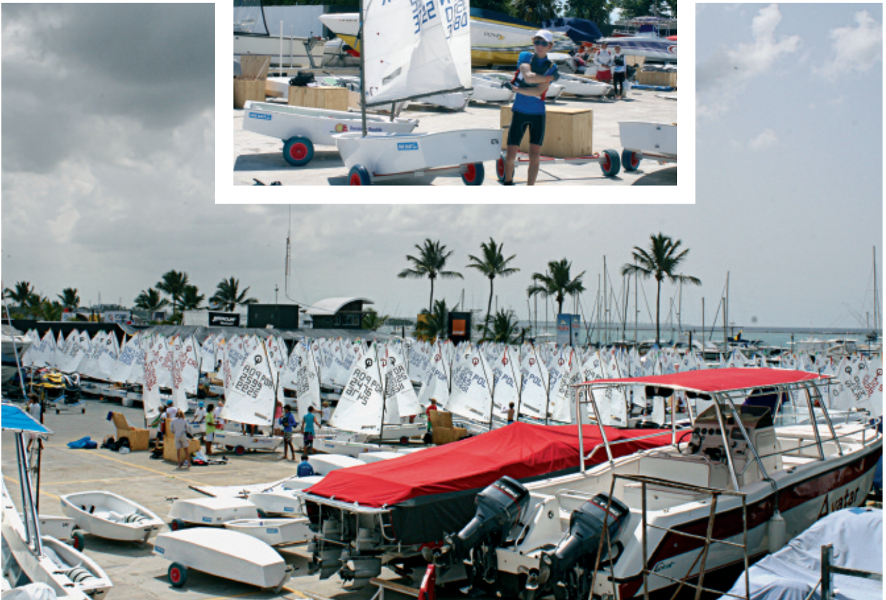
Båtene klare foran "dagens" seilaser