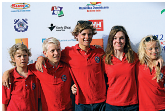
Det norske VM laget