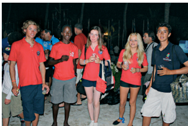
Forbrødring; seilere fra Norge, Antigua og Sør Afrika